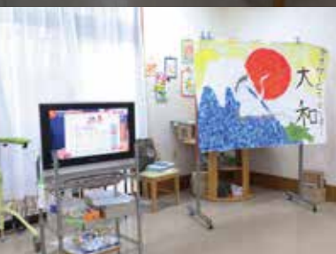
テレビも楽しめます