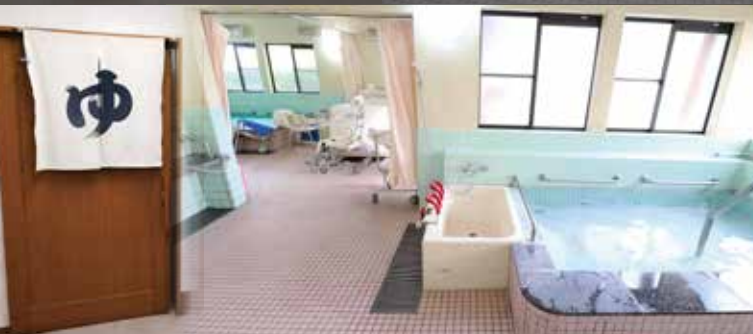
大浴槽・個人浴槽・車椅子専用浴槽完備