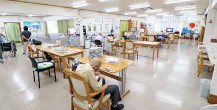
広々としたデイフロアー