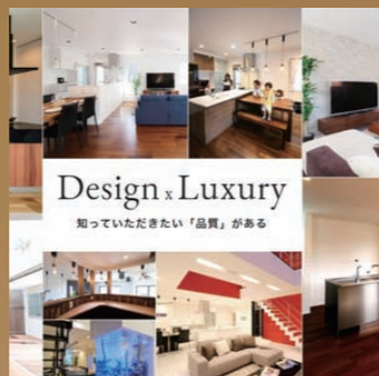
不動産・建築事業