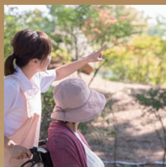
介護サービス事業